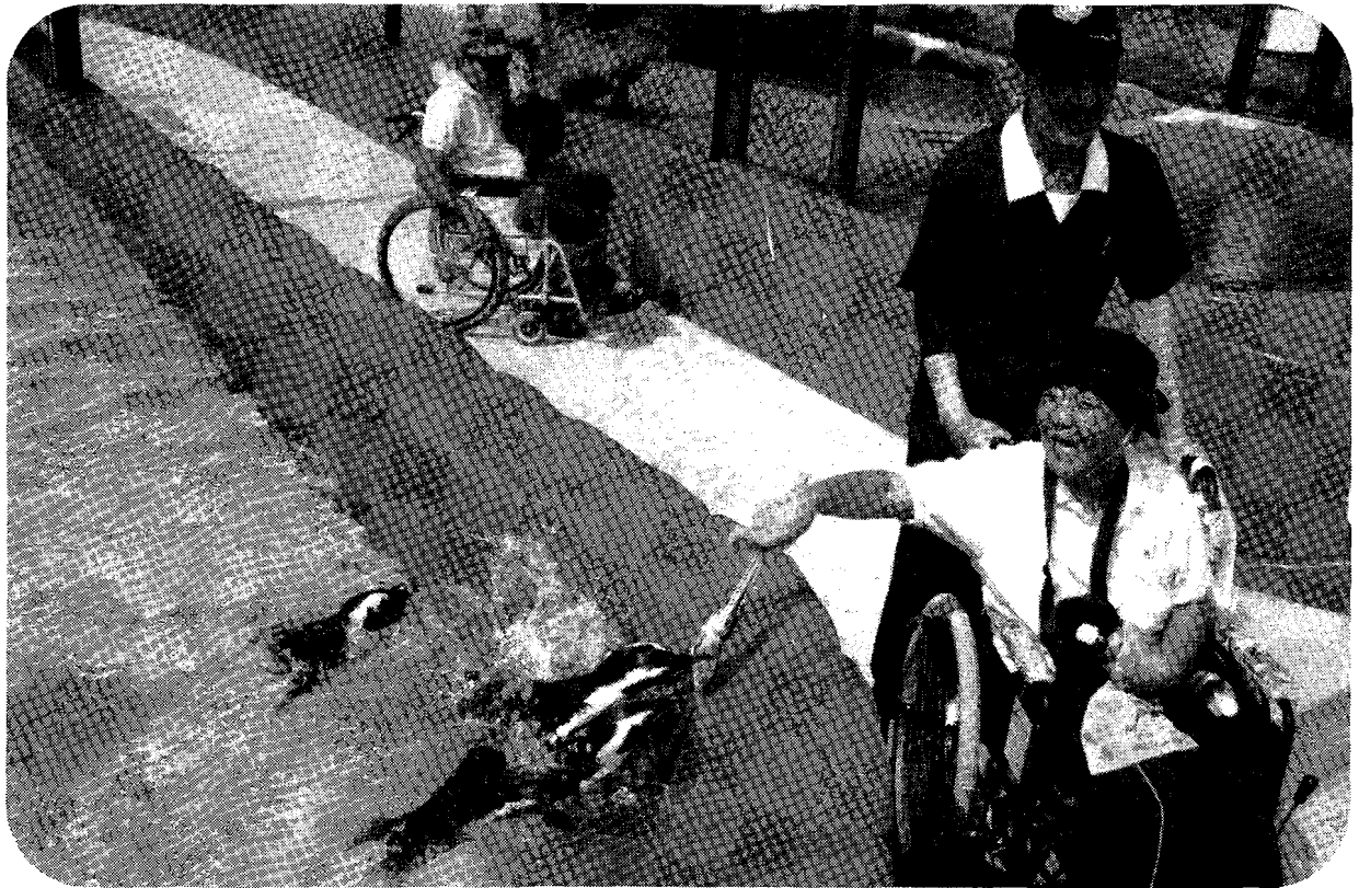
- ヨーデルの森にて -

平成23年12月20日 発行 〒671-2234 姫路市西脇1-4-48の4 TEL (079) 269-0410 FAX (079) 269-0495 http://www.harimafukushi.com/ E-mail harimafukushi@meg.winknet.ne.jp