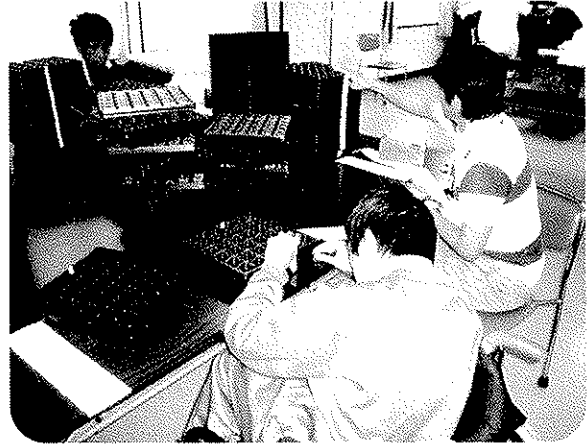
▲トレイのシール貼り作業 初めてのシール貼りに奮闘中!!

3名はどんな印象を持ったのでしょうか？後日頂いた文集の中から抜粋して紹介したいと思います。